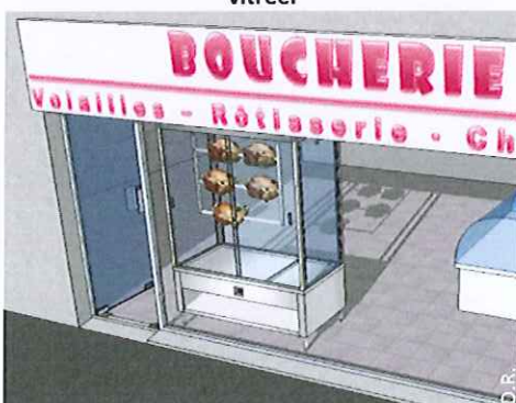
Un four, une rôtissoire, ou tout autre dispositif émettant une forte source de chaleur, à proximité de la baie vitrée.