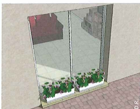
Une jardinière contre la baie vitrée, côté extérieur ou intérieur. Ou tout autre élément d'occlusion.