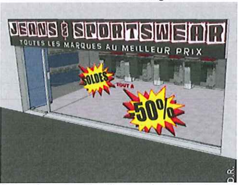
Des stickers de couleur foncée et contrastée sur les vitrages.