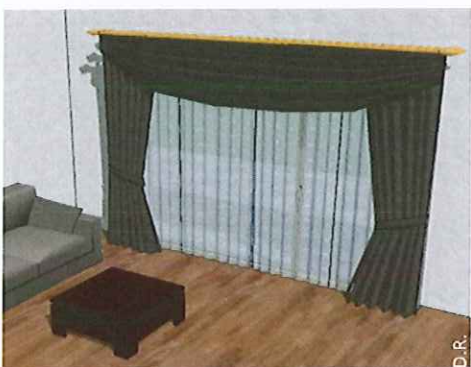
Un rideau foncé et opaque