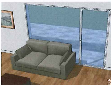
Un canapé (ou tout autre mobilier) plaqué contre la baie vitrée.

Voici des exemples de situations où le risque de casse thermique du vitrage est présent, et qu'il convient donc d'éviter :