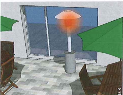
Un parasol chauffant, ou tout autre dispositif de chauffage à proximité de la baie vitrée.